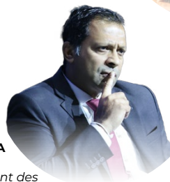
Pradeep KURUKULASURIYA Secrétaire exécutif Fonds d'équipement des Nations Unies (UNCDF)