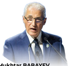
Mukhtar BABAYEV Président de la COP29 de la CCNUCC et Représentant du Président de la République d'Azerbaïdjan