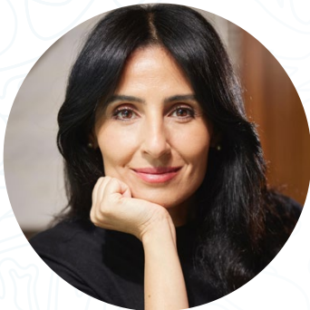
Razan Khalifa Al Mubarak

« L’UICN se situe au confluent de courants divers – la science, la politique, les communautés de pratique du monde de la conservation – et c’est à ces carrefours que la magie opère, là où la collaboration transcende les frontières pour créer des solutions transformatrices pour notre planète. »