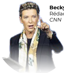
Becky ANDERSON Rédactrice en chef CNN