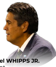
Surangel WHIPPS JR. Président République des Palaos