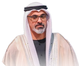
His Highness Sheikh Khalid bin Mohamed AL NAHYAN Prince héritier d'Abou Dhabi Emirats arabes unis